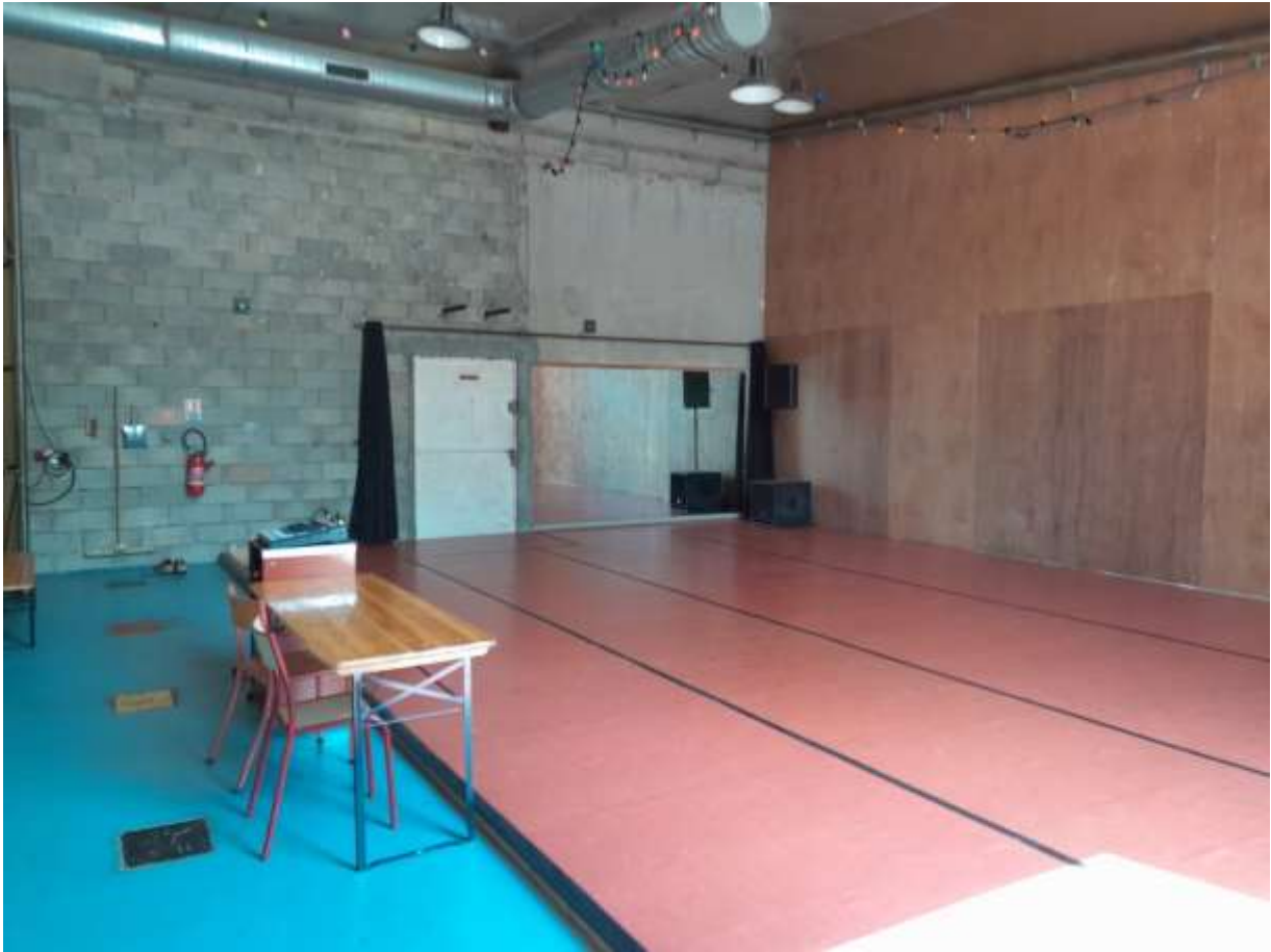
À la lumière du jour / Miroirs découverts