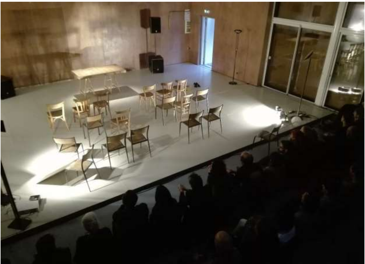
Avec la paroi ouverte sur l'espace accueil