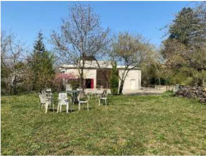
Le pré : Potentiel espace de travail en extérieur