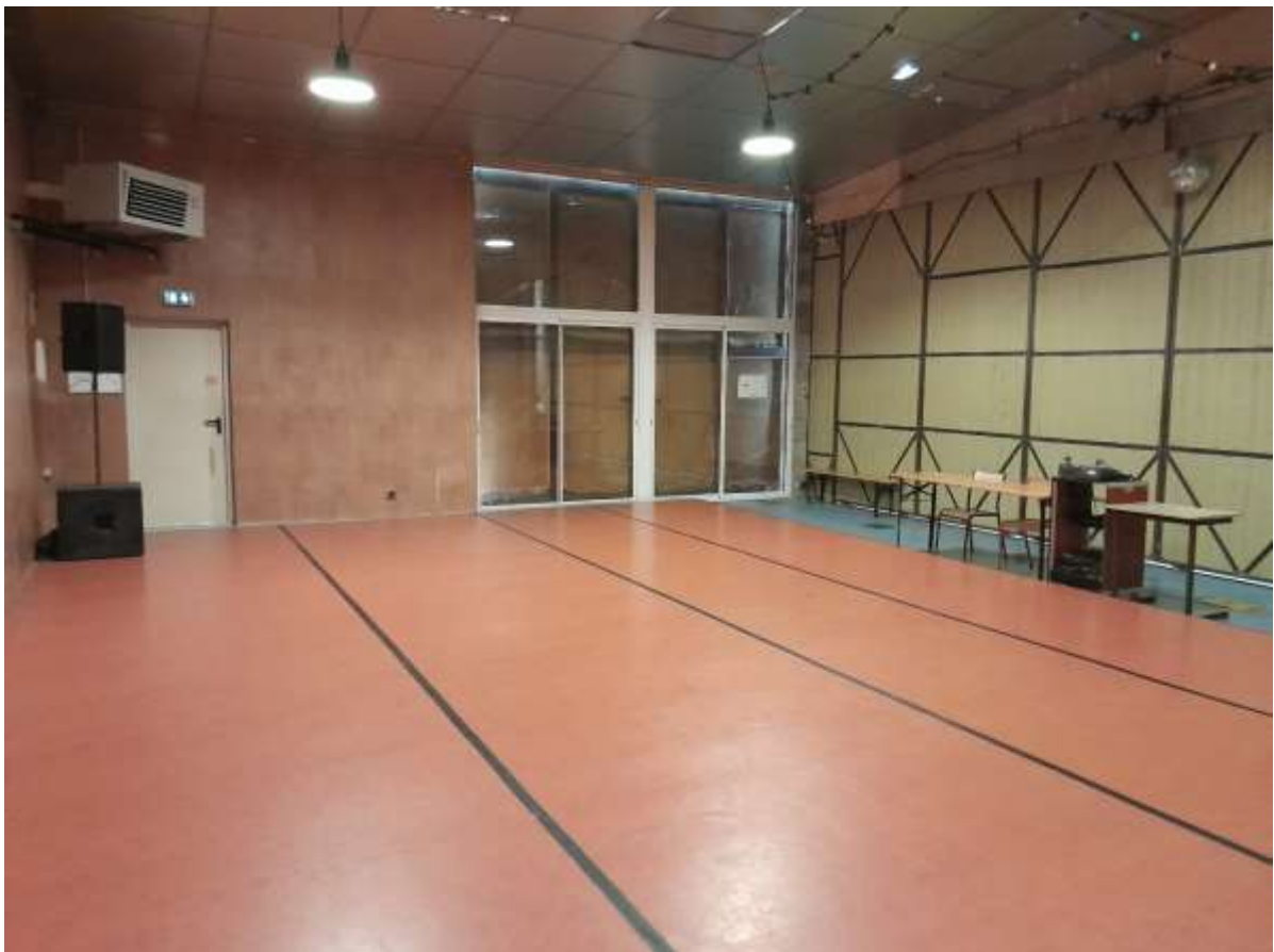
Sous éclairage et volet fermé