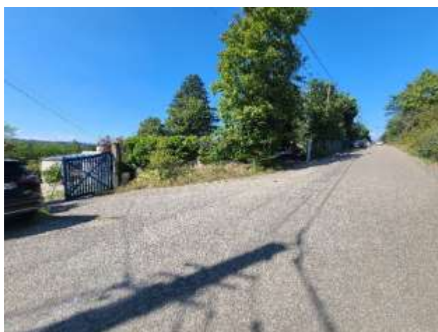
Route d'accès et portail principal

Nous disposons d'un parking dans l'enceinte du lieu vous permettant de stationner vos véhicules. Tous les véhicules doivent y stationner. Il est possible de se garer devant le petit studio et le grand studio le temps du chargement et du déchargement uniquement.