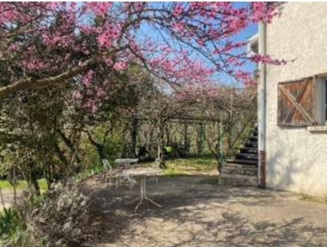
Coin terrasse pour les repas