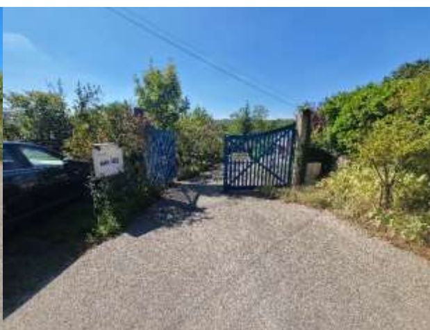
Portail principal vu de l'extérieur