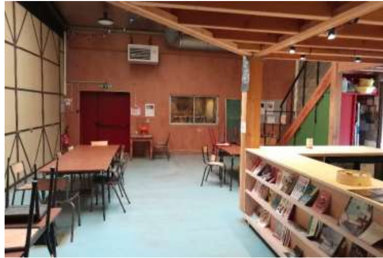
Accueil et bar