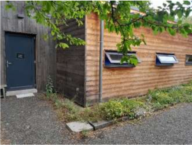
Gîte et entrée du Grand Studio