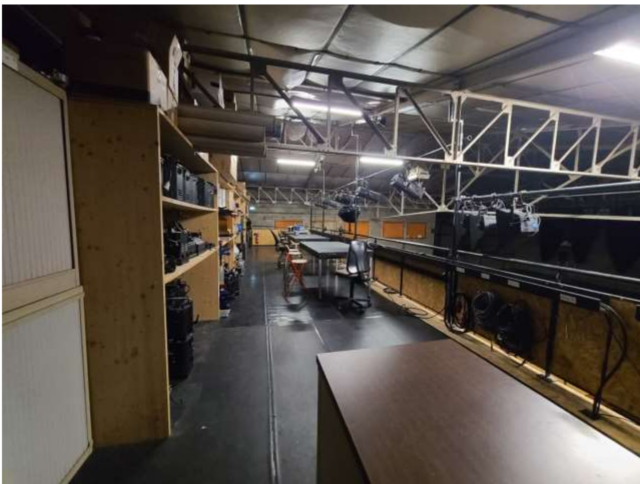
Mezzanine Technique / Possibilité d'y installer une régie