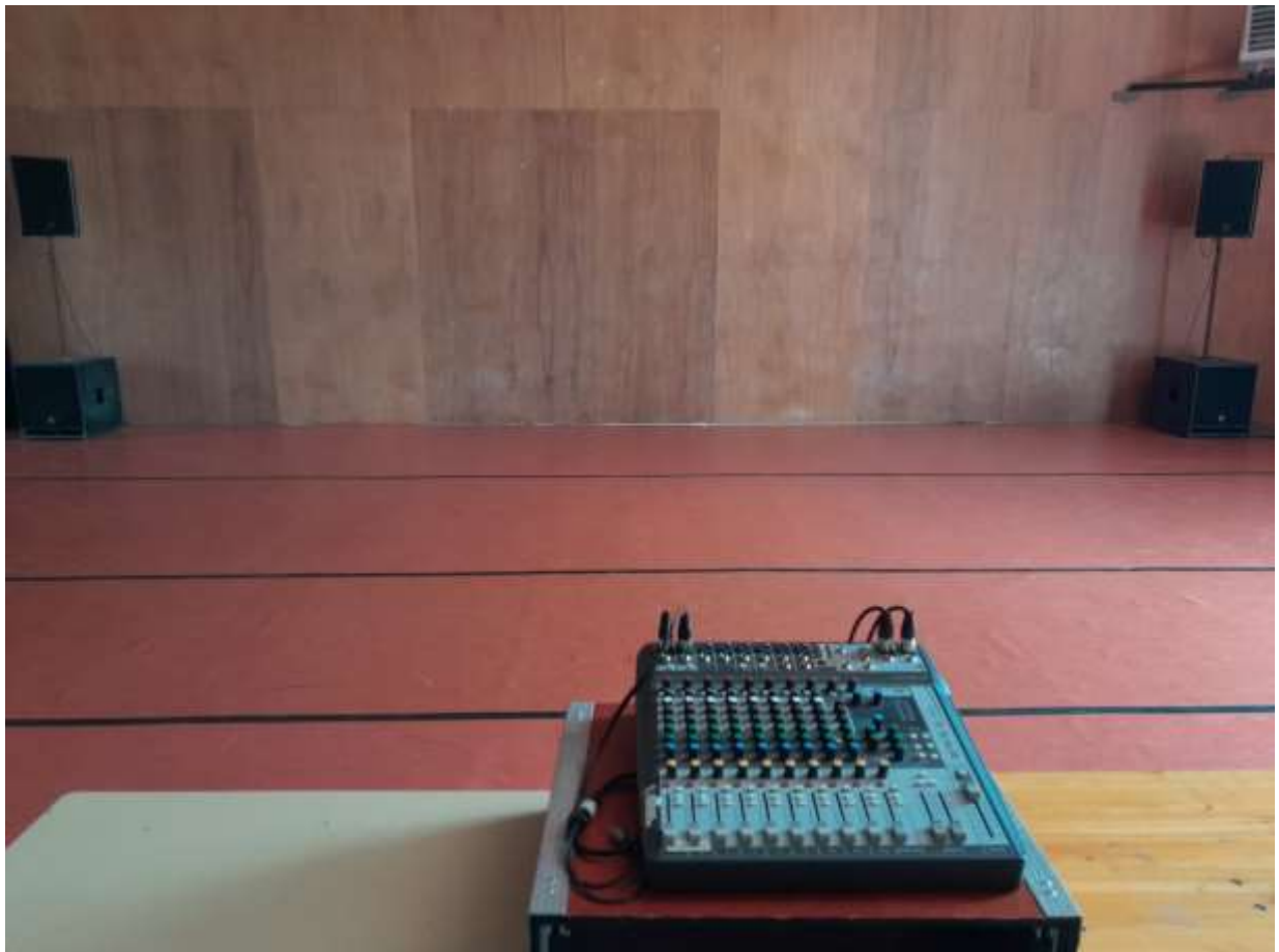
Depuis la régie