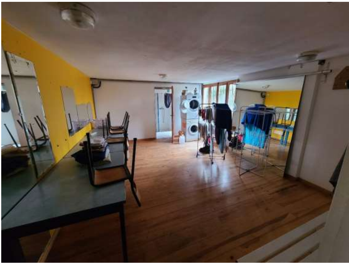
Loges et vestiaires mixtes avec douches et machine à laver / Espace accolé au Grand Studio