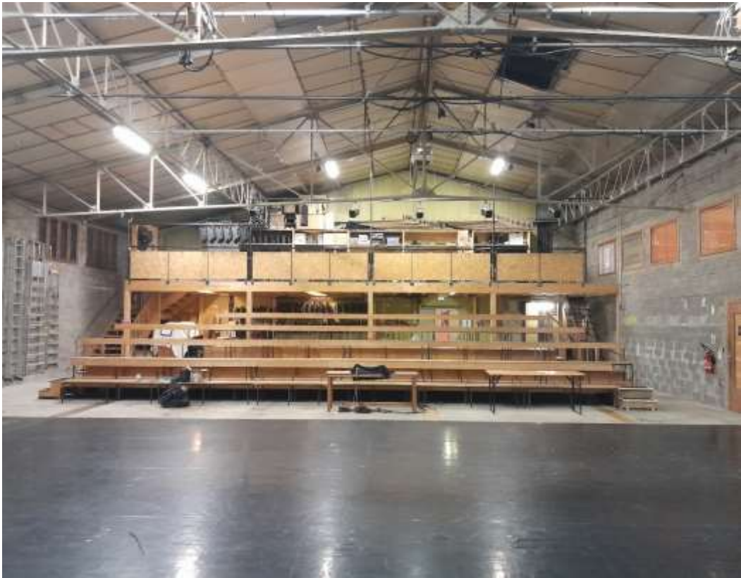
La mezzanine technique permet d'éclairer la scène frontalement