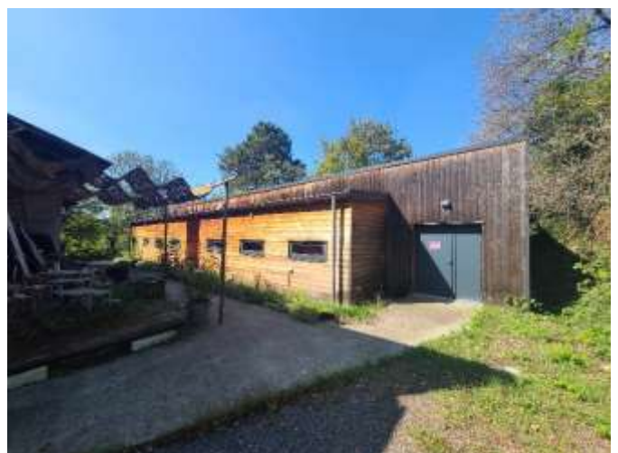
Le gîte et sa terrasse ombragée