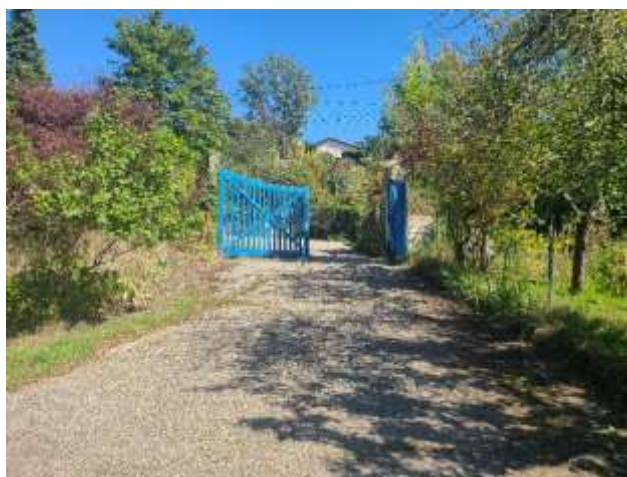
Portail principal vu de l'intérieur