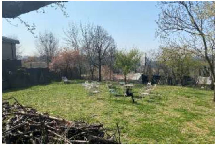
Autre point de vue du pré