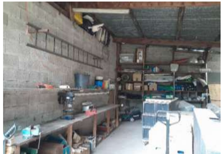
Hangar ouvert - Etabli