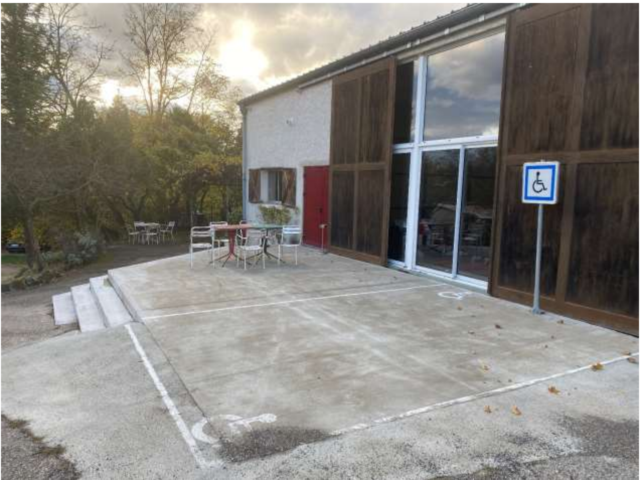
Terrasse et baie vitrée donnant sur le studio