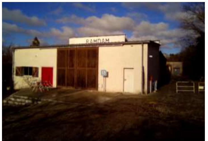
Entrée du bâtiment principal