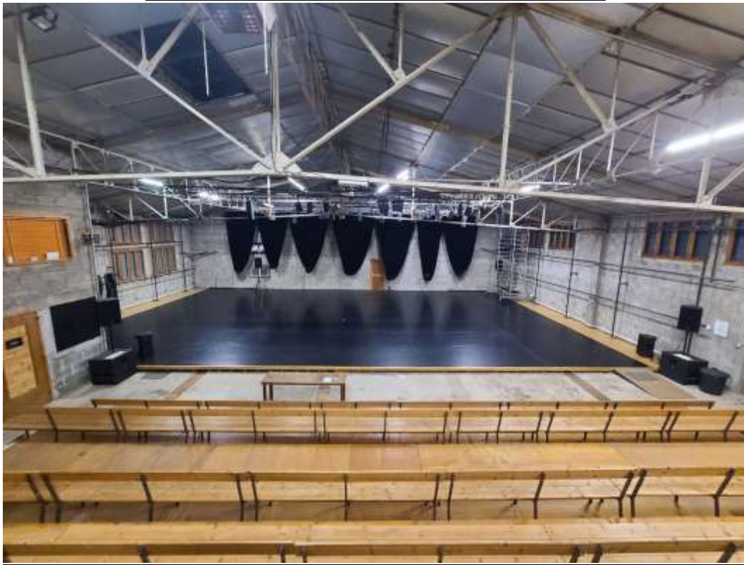
Vue depuis la mezzanine technique